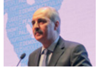
Prof. Dr. Numan KURTULMUŞ T.C. Başbakan Yardımcısı

Türkiye ile AB arasındaki ilişkilerin de aynı şekilde ilerletilmesine ihtiyacımız var. Avrupa, Ortadoğu ve Orta Asya arasında konumlanmış olan Türkiye'yi; son derece büyük bir rol oynayan bir aktör olarak görüyorum. Ortadoğu'nun problemlerini çözmekte büyük bir rol oynayabilir.