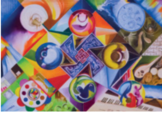
Ressamın kuş bakışıyla dünyayı özeti