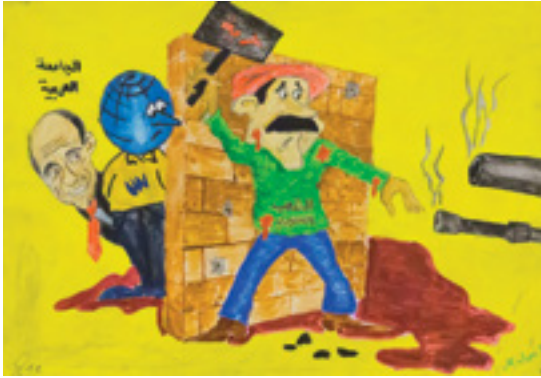
Özgürlük isteyen Suriye halkının durumunu duvar arkasında izleyen dünya ve Arap ülkeleri.