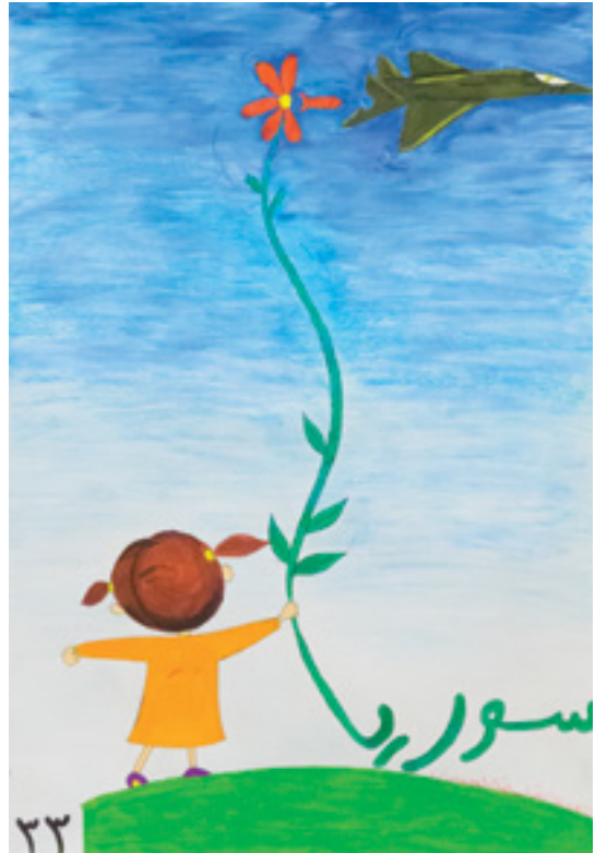
Resimde; Arapça Suriye yazısının devamında çıkan papatyanın bir savaş uçağını düşürebileceğini görmekteyiz. Buradaki mana, barışın ve sevginin savaşa galip geleceğidir.

Sempozyum, aralarında Ortadoğu uzmanlarının, sivil toplum temsilcilerinin, uluslararası düzeyde tanınmış akademisyenlerin yer aldığı çok değerli konukları ağırlama görevini üstlenmiştir.