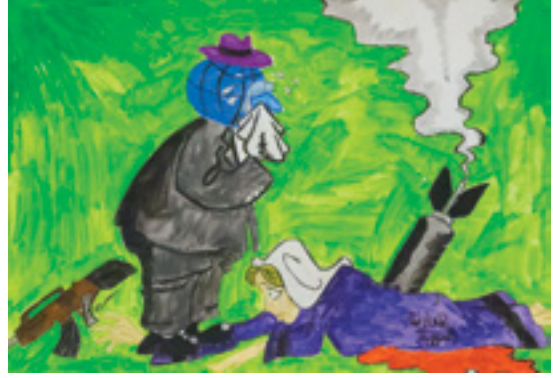
Saldırıya uğramış Suriye'nin nefsi müdafaa için yaptığı hamleye dünyanın karşı çıktığını gösteren bir resim.