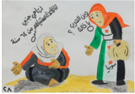
Genç Suriyeli bayanın yaşlı Filistinli bir kadına "Arap ülkeleri nerede ne zaman imdadımıza yetişecekler? sorusuna Filistinli kadının verdiği cevap: Gel otur ben onları 64 yıldır bekliyorum daha gelmediler.

Hasan Kalyoncu Üniversitesi Ortadoğu Araştırmaları Merkezi olarak bu sempozyum ile, aralarında akademisyenler, politikacılar, uluslararası seviyede tanınmış aktivist ve sivil toplum kuruluşu temsilcilerinin yer aldığı değerli bir grup insanı biraraya getirerek, yukarıda sözü edilen sorunların kökenlerini tartışmayı ve politika yapıcıları, sivil toplum örgütleri ve uluslararası organizasyonlar için çözüm önerileri geliştirmeyi amaçlıyoruz. Yaşamakta olan siyasi karmaşanın en çok bu ülke halklarını etkilediği bilinmekle birlikte, gelişmelerin ister istemez bölgesel ve küresel etkilerinin olduğu bilinen bir gerçektir. Bu yüzden, hepimizin ortak amacı bir araya gelmek ve söz konusu çatışmalar için çözüm önerileri geliştirmektir. Siz değerli katılımcıları "Ortadoğu'da Barış: Oyuncular, Sorunlar ve Çözüm Arayışları Sempozyumu"na değerli katkılarınızı sunarak destek vermeye davet ediyoruz.